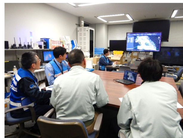
北陸地整・石川県への説明 (13日)