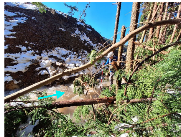
河道閉塞の通水状況 (11日)