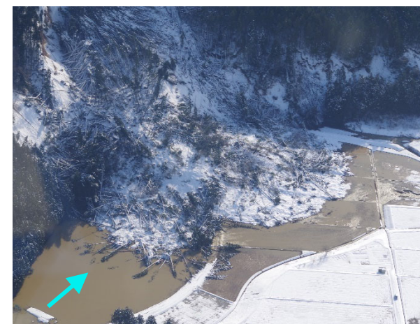
町野町付近の河道閉塞(14日)