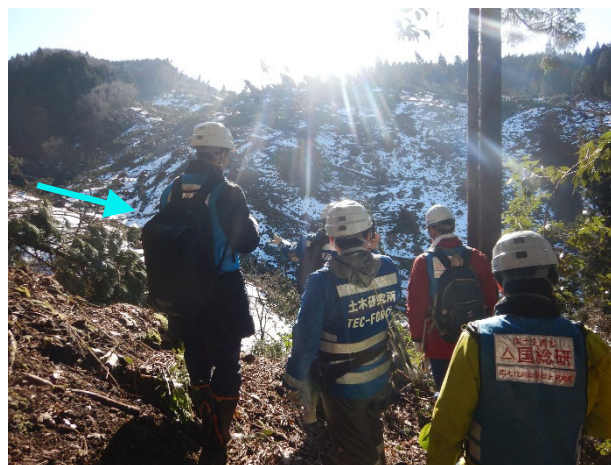
河道閉塞部の状況 (11日)