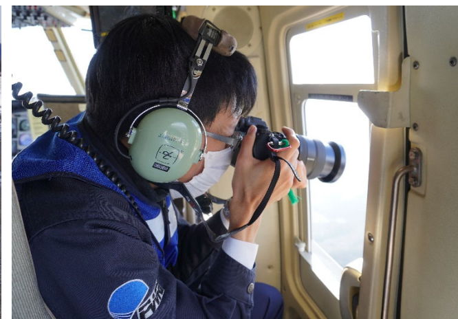
ヘリからの撮影状況(14日)