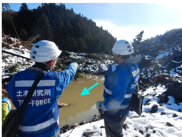
閉塞部下流の土砂堆積状況 (11日)