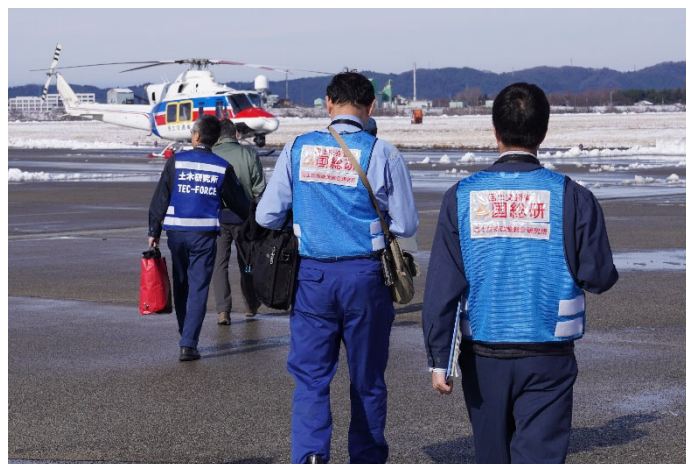
北陸地整ヘリ「ほくりく号」(14日)