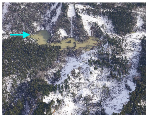
町野町付近の河道閉塞(14日)