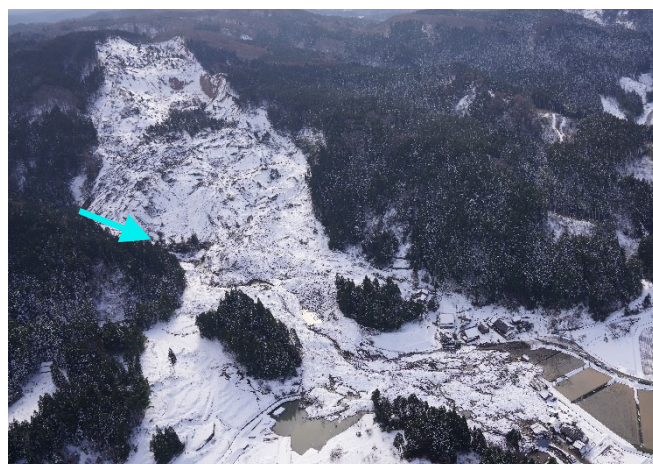
市ノ瀬町の地すべり・河道閉塞(14日)