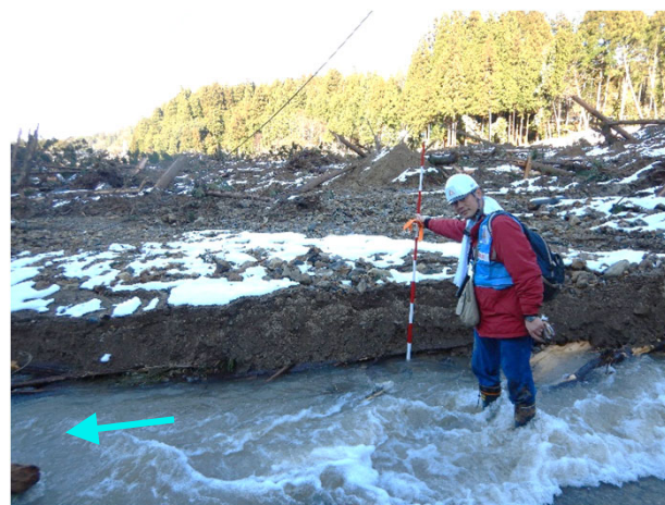
集落付近の土砂堆積状況 (11日)