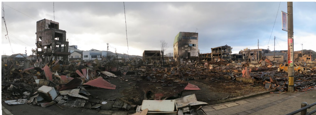
焼失した市街地を北側から撮影した様子