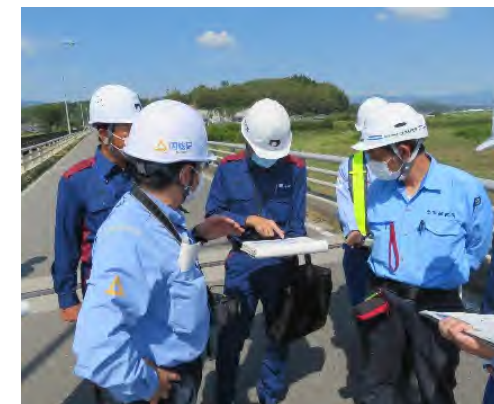
熊本県との技術的助言打合せ