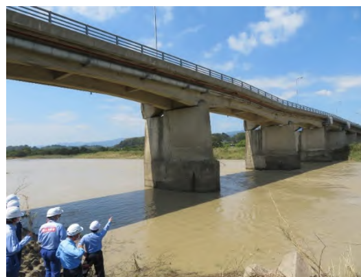
橋梁被災状況調査 (熊本県錦町)