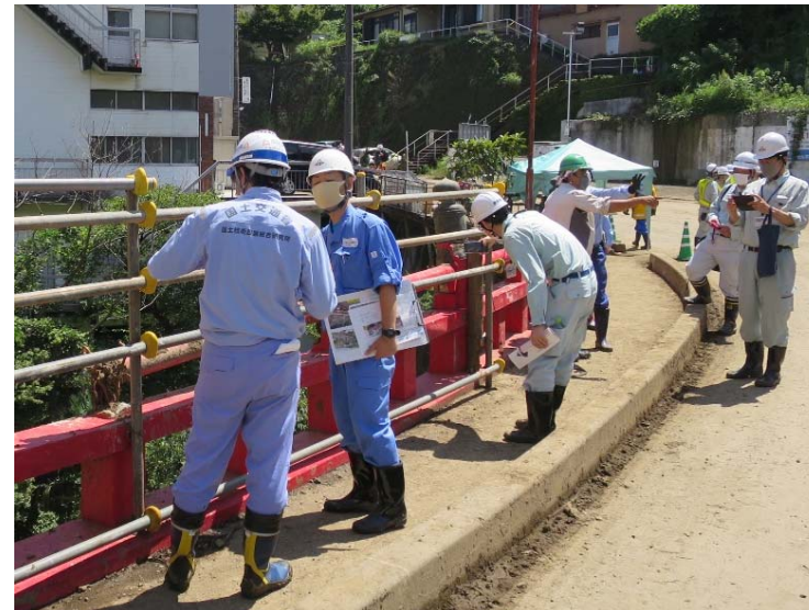
<熱海市 国道135号逢初橋>