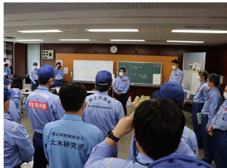
TEC-FORCE活動視察(渡辺副大臣・朝日政務官)