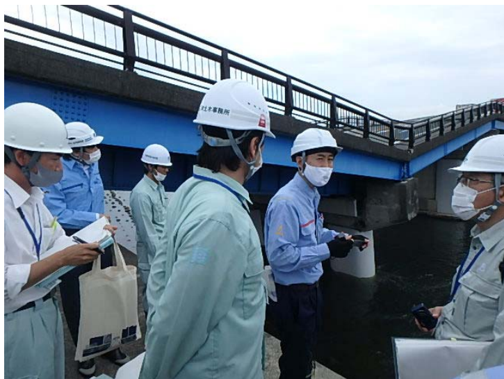
<沼津市 黄瀬川大橋>